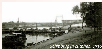
Schipbrug in Zutphen, 1936